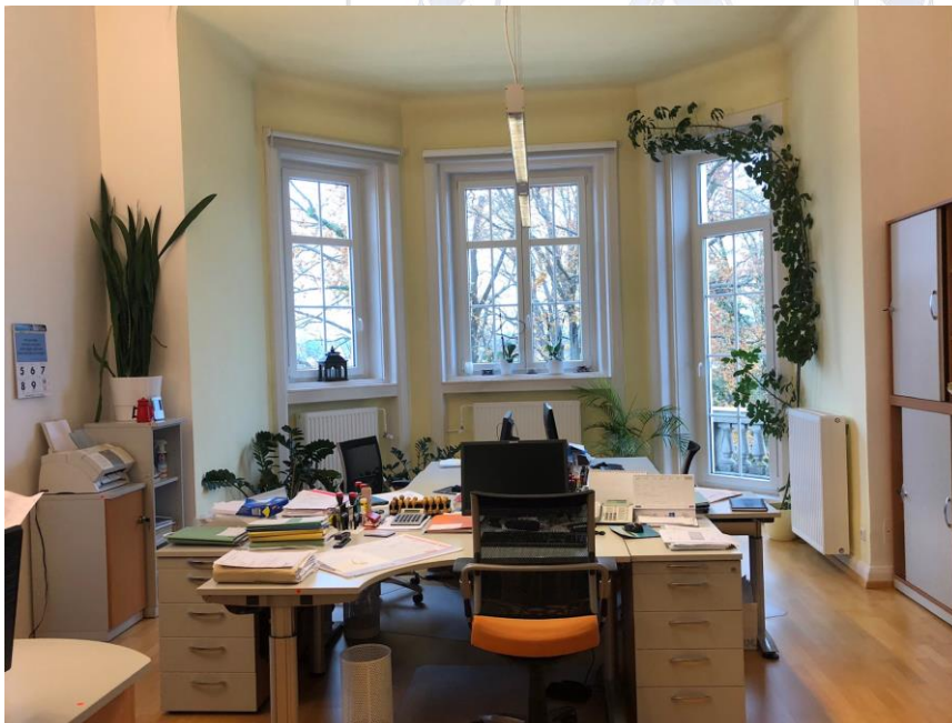
Büro der Mitarbeiter